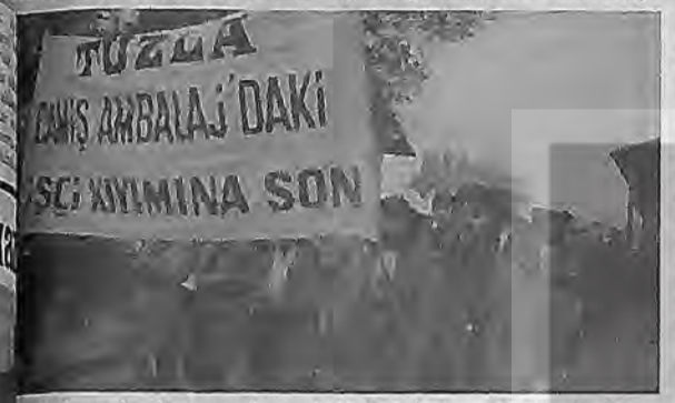
İşçinin başından beri tartışılan toplu vizite eylemi ancak 38. günde gerçekleştirilebildi.

İşçilerin fabrikayı terk etmeyecek demesi tek başına kazanmak için yeterli değil. Suskunluğun, direnişin kendi kendine sessizce bitmesine vermeden üst eylemlilere sıçrama aşılması zorunlu. İşçilerin "bu otuzun bir şey başaramayız" demelerine rağmen hareket geçememe devrimi işçilerin önderliğine du-